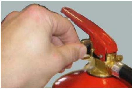
1. Dra ur säkerhets sprinten