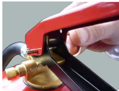
7. Montera säkringssprint