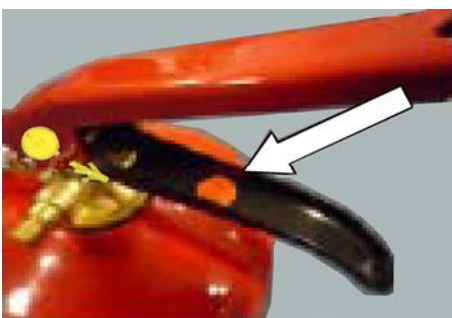
9. Fäst kontrollmärke på bärhandtagets insida