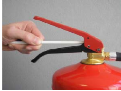
2. För in mätverktyget för att mäta ventilspindelns höjd