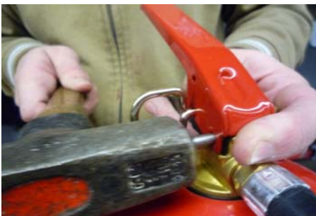
6. Montera fast den nya avtryckaren